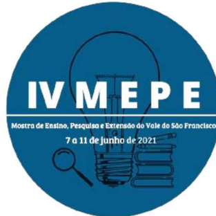
Figura 1: título da figura/ imagem

Centralizadas; Título e Fonte tamanho 10, centralizados. Ex: